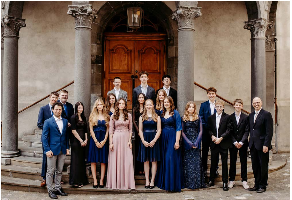
Konfirmation Martinskirche, 1. Juni 2025