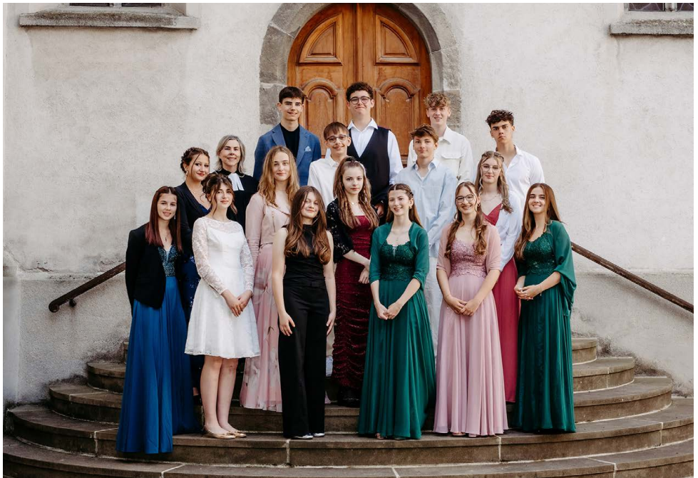
Konfirmation Martinskirche, 15. Juni 2025