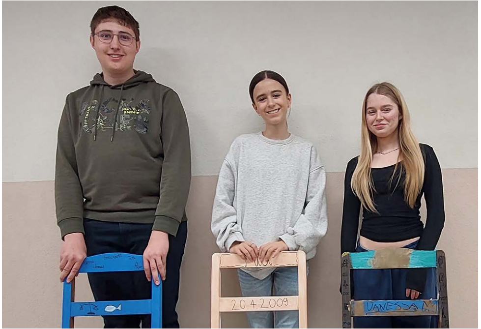
Konfirmation Maladers, 13. April 2025