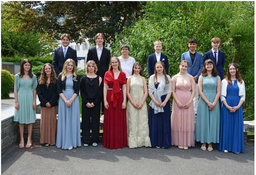
Konfirmation Comander, 1. Juni 2025