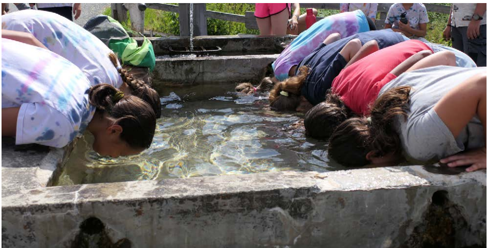
Wohltuende Abkühlung im «Kinderlager im Sommer»

Primarschülerinnen und Primarschüler hatten zweimal im Jahr die Möglichkeit, ein Lager zu besuchen: das Tageslager im Frühling zum Thema «Bauen» im Comanderzentrum und das Kinderlager im Sommer mit dem Titel «Daniel –