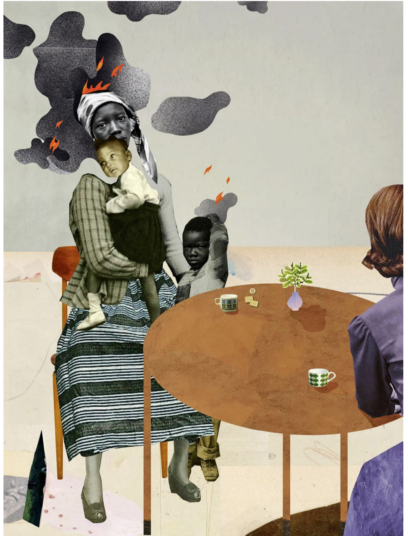
Illustration: Corinna Staffe

Ein solch umfassendes Angebot für Geflüchtete ist schweizweit die Ausnahme, der Zugang zur psychologischen Versorgung kantonal sehr