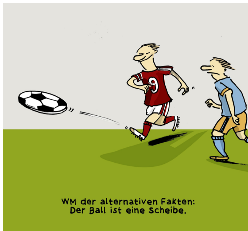
WM der alternativen Fakten: Der Ball ist eine Scheibe.